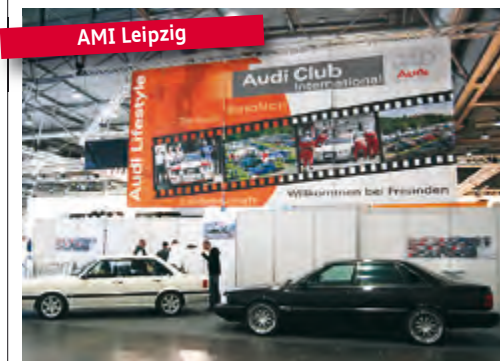
AMI Leipzig Hallenwechsel im Osten. Der Erfolg bleibt jedoch