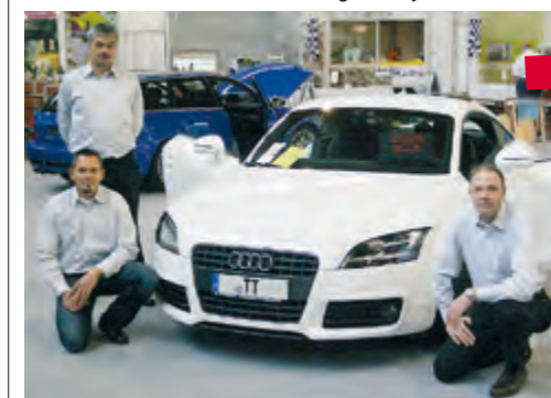
Der Audi Club Filstal – Erste Messepräsenz überhaupt