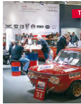
Die neue Audi CI findet erstma