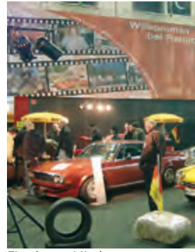
Eine bunte Mischung aus sport