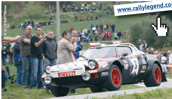
Der Rallye-Veteran Lancia Stratos S4 - Ebenfalls eine Legende des Rallysports.