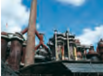
Die Völklinger Hütte.