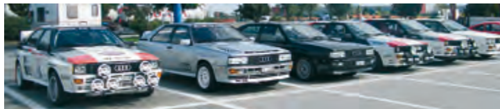
Die Fahrzeuge der 1. Urquattro Clubs und der Schweizer Urquattro IG