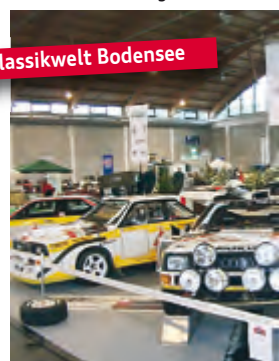
Klassikwelt Bodensee 1.Urquattro Club (D) und Urqua