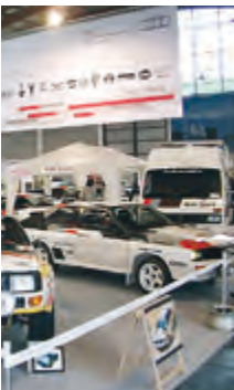
ttro IG (CH) gemeinsam