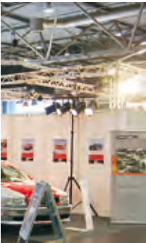
Ein toller Messestand