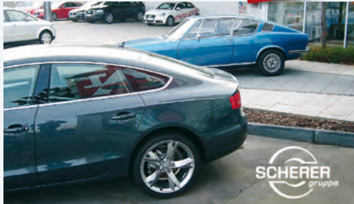
Das neue Audi A5 „4-Türer-Coupé“ – Heute neudeutsch „Sportback“ genannt.