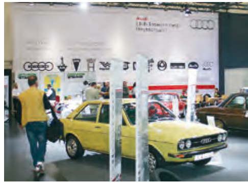
Die Stellfläche gegenüber dem Vorjahr wurde verkleinert