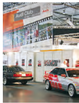
Nach vielen Unwägbarkeiten: