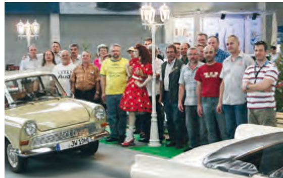
Gemeinschaftsfoto des Messeteams aus Friedrichshafen