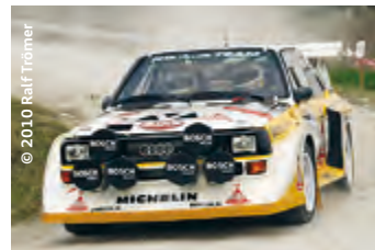
S1 quattro® im rasanten Drift.