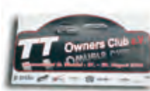
Das Schild zum Event.