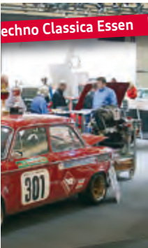
lig seine Anwendung