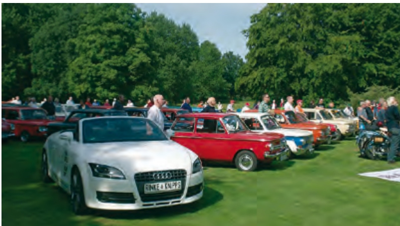
Text: Thorsten Schache.

Veranstaltungen dieser Art sind zur Verfestigung des Gemeinschaftsgedanken enorm wichtig. Schön auch, dass Kevin Thiel, Audi Clubbetreuung, vor Ort ist und den aktiven Länderverband in Italien unterstützt.