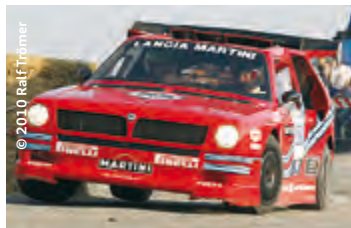
Das „Lancia-Beast“ punktet.