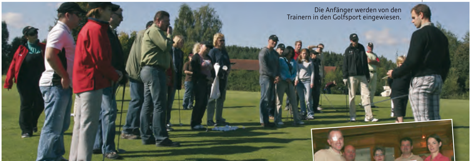
Die Anfänger werden von den Trainern in den Golfsport eingewiesen.

Text: ACI-Vorstand.