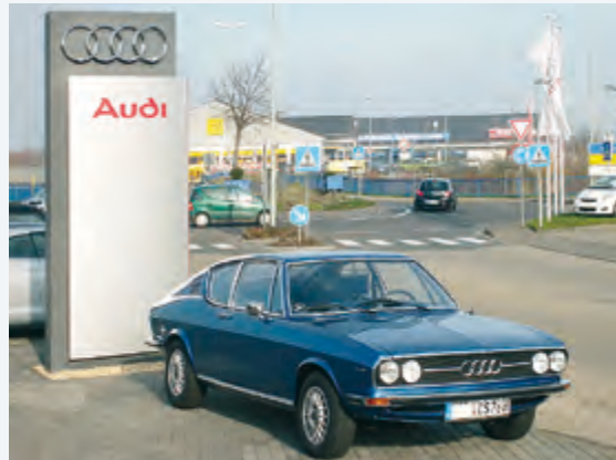
Der Klassiker im Trio – Das gepflegte Audi 100 Coupé S.

Präsentation des neuen Audi A5 Sportback und des neuen A7 Sportback im Autohaus Scherer, Mayen. Als klassischer Vorfahre der beiden stellte man Ihnen ein 1976er Audi 100 Coupé S zur Seite.