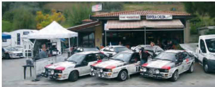
Die Clubfahrzeuge vor dem Rallye-Café