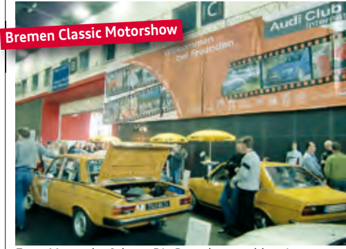
Bremen Classic Motorshow Erste Messe des Jahres. Die Besucheranzahl steigt

■ An 4 Standorten stellt der ACI und seine Mitgliederclubs in 2010 das Konzept des Dachverbandes und sein Fahrzeugspektrum vor. Die zentrale Botschaft an die Besucher der ACI-Messen lautet: Vielfalt statt Uniformität! Nach der Bremen Classic Motorshow, der