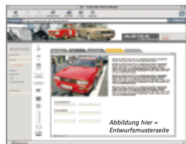
Abbildung hier = Entwurfsmusterseite

Ähnlich dieser Abbildung wird die Exponate-seite einmal aussehen. Eingabe von Baujahr und Fahrzeugtyp führt dann zu den gewünschten Ausstellungs-exponaten