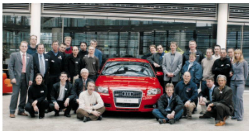
Gruppenfoto mit „Dame“ 04.12.2004, Ingolstadt. Zusammenkunft (fast) aller Clubvorstände aus dem europäischen Umfeld und den USA.

Am 04.12.2004 trafen die Vertreter der europäischen Audi Markenclubs in Ingolstadt zusammen um die weitere Vorgehensweise bei der Gründung eines weltweiten ACI zu besprechen. Die Clubleitung des ACI stellte den Anwesenden den Gründungsweg und die Struktur des aktiven Audi Club International vor. Analog wurden Maßnahmen und Wege beschrieben, die für den internationalen Aufbau notwendig sind. Eine direkte Mitgliedschaft im bestehenden ACI ist wegen länderspezifischen Gegebenheiten nicht vorteilhaft. Um die Betreuung der jeweiligen Clubs in den Ländern zu garantieren und die Anbindung an die AUDI AG zu ermöglichen wird jedes Land einen eigenen ACI gründen. Dieser Aufbau ermöglicht verschiedene Audi-Club-Foren, in denen Landesvertreter und Importeure zusammentreffen. Der folgende Schritt wird die Gründung eines Welt-Forums sein, welches sich künftig allen internationalen Angelegenheiten widmet.