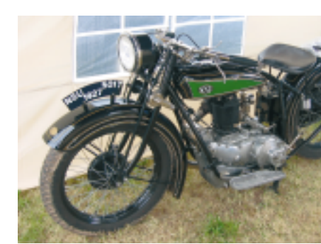
▲ Die gesamte NSU-Familie war vertreten. Hier einige der anwesenden 80-Fahrzeuge über deren optischen und technischen Zustand so mancher Besucher erstaunt war.